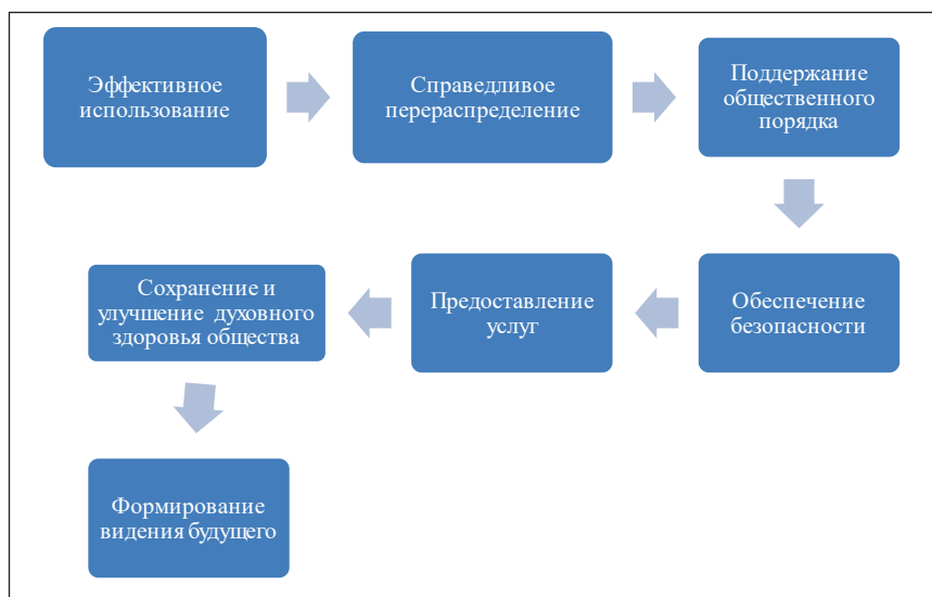
Рис. 2. Основные задачи системы государственного управления

– постановления и распоряжения Кабинета Министров Украины;