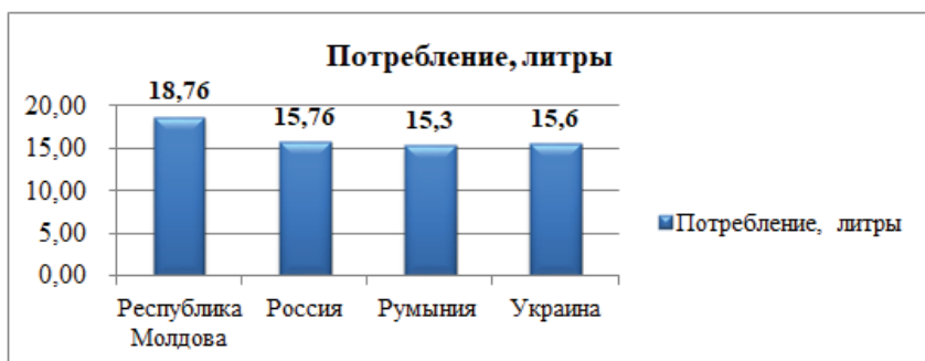
Рис. 1.1. Рейтинг стран мира по уровню потребления алкоголя [разработано автором по 1]

тодике Всемирной организации здравоохранения (World Health Organization) Республика Молдова находится на 1 месте среди 188 стран [15].